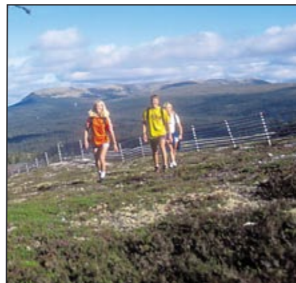
Tre Toppar tillför nya aktiviteter, både inom vinter- och sommarturism